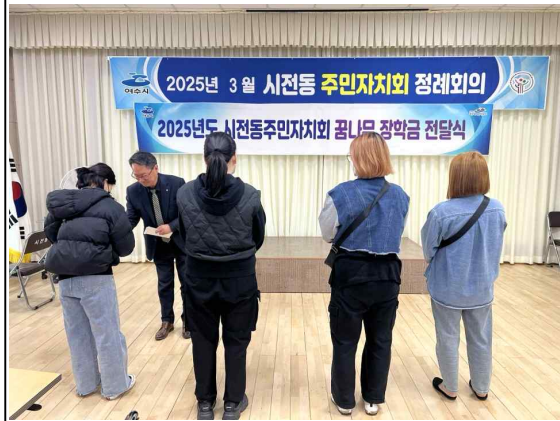
쓰레기 불법투기 취약지 청결활동 / 경로당 합동 생신 챙겨드리기 여수 르네상스 다함께 5대 실천 시민운동/ 시전동 주민자치회 꿈나무 장학금 전달