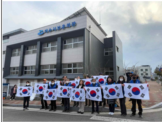
경로당 방문 및 안부 인사 / 주차난 해소를 위한 대책 마련 현장 점검 불법투기 취약지 청결활동 / 3.1절 맞이 나라사랑 태극기 달기 운동 추진