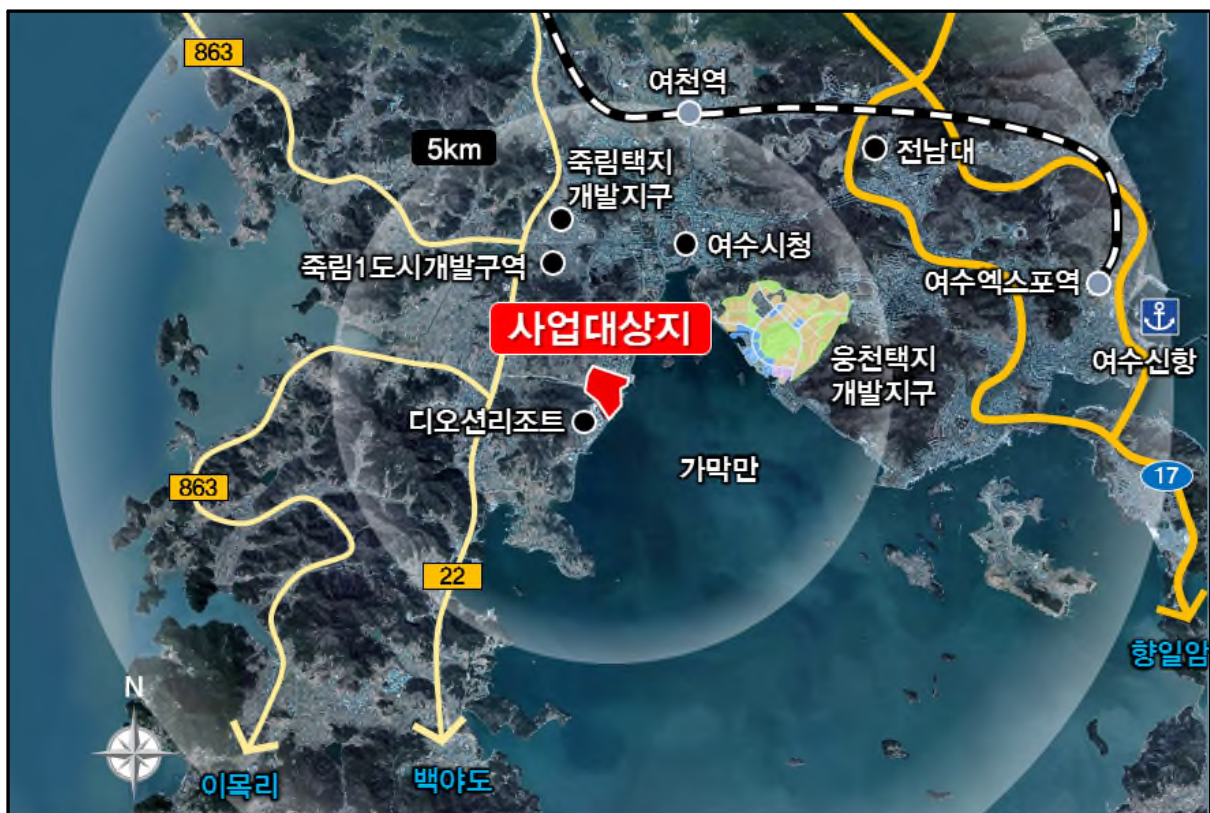
(그림 2.4-1) 사업지구 위치도