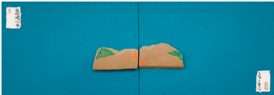
島嶼여수, 그 섬의 울림 화태도 2021, 나무판넬에 혼합재료, 아크릴, 36.0×100.0cm