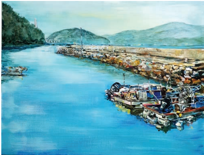
화태도 선착장 2021, 캔버스에 아크릴, 40.9×53.0cm