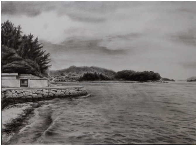
화태도 2021, 종이에 연필, 콘테, 60.6×72.4cm