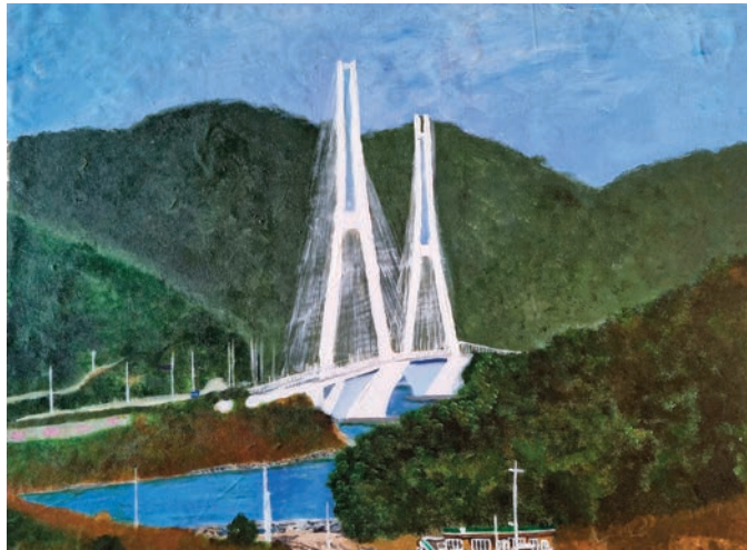
화태에서 본 대교 2021, 캔버스에 아크릴, 40.9×53.0cm