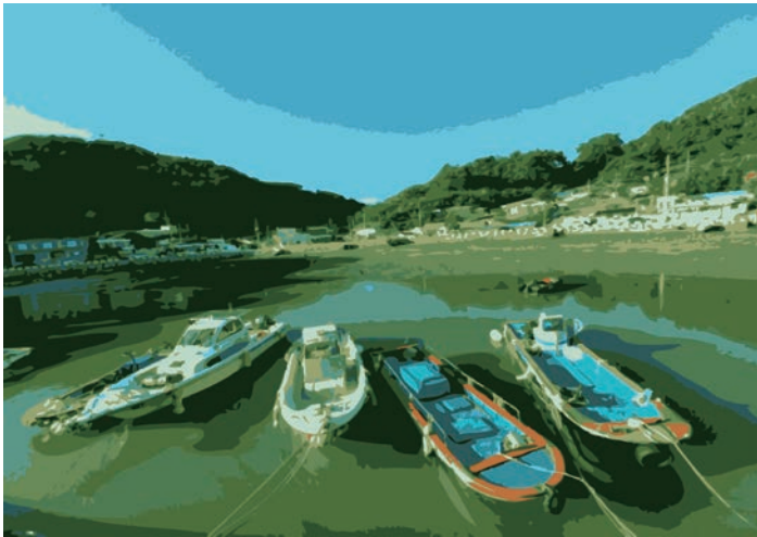
화태의 휴식 2021, 컴퓨터 그래픽, 59.0×84.0cm