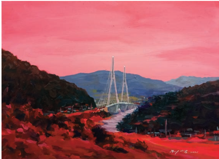
화태도 화태길에서 바라본 화태대교 2021, 캔버스에 아크릴, 33.4 × 45.5cm