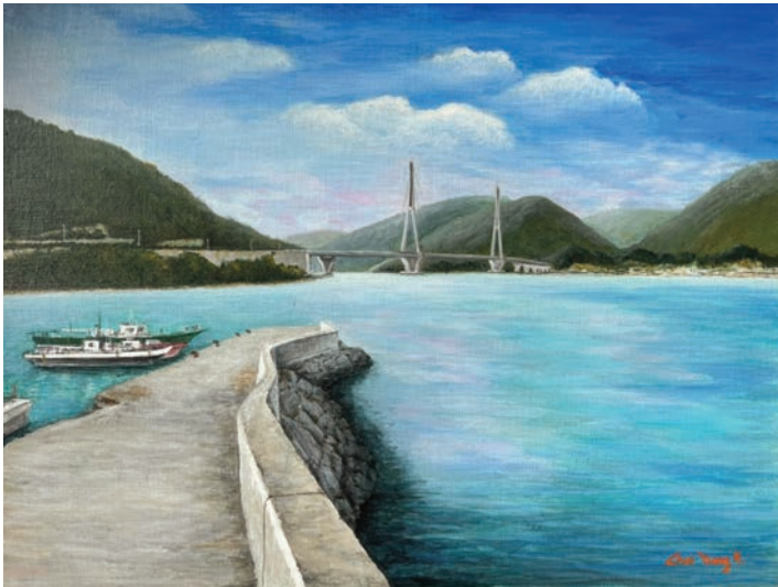
화태도의 풍경 2021, 캔버스에 아크릴, 53.0×72.5cm