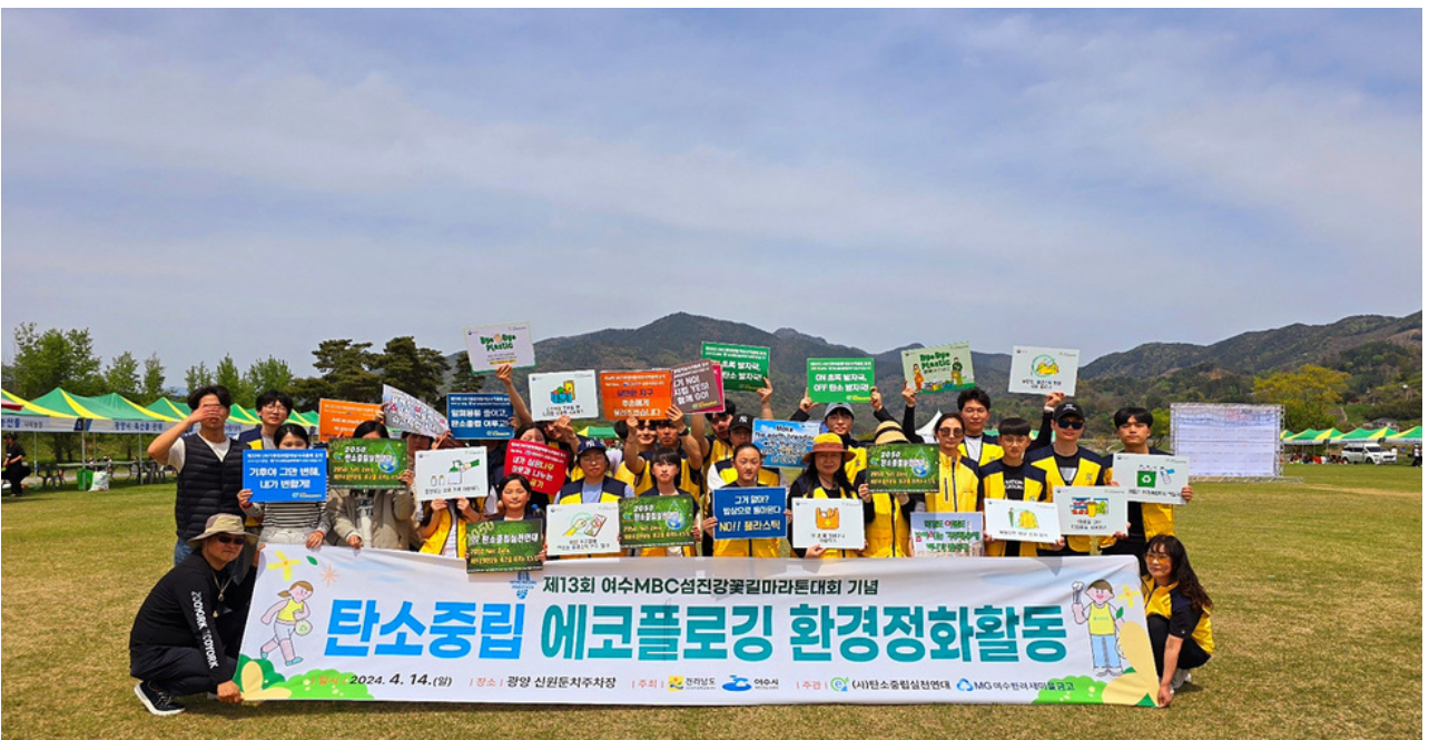
( http://www.yeosu.go.kr )