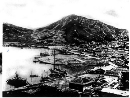
1920년대 중앙동 일대