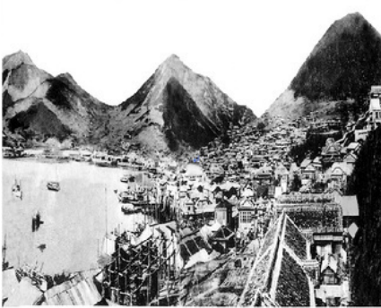
1934년 중앙동 구항