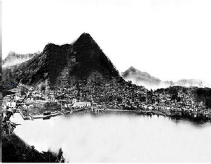
1910년대 예암산에서 본 여수항