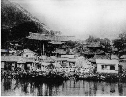
1907년 진남관 일대