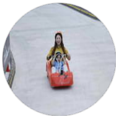
관리자님의 가족이 함께..

여수 향일암-종점횃집-무슬목피서지(몽돌 해변)-예술랜드리조트-여수해상케이블카-자산공원-오희도-고소동