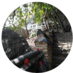
관리자님의 일출부터 일..

여수 향일암-종점횃집-무슬목피서지(몽돌 해변)-예술랜드리조트-여수해상케이블카-자산공원-오희도-고소동