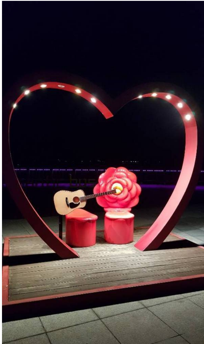
여수관광문화( http://tour.yeosu.go.kr )