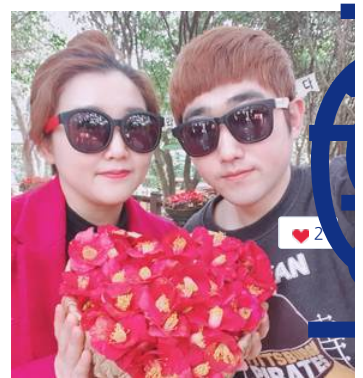
오동도는 저희 부부의 10년째 데이