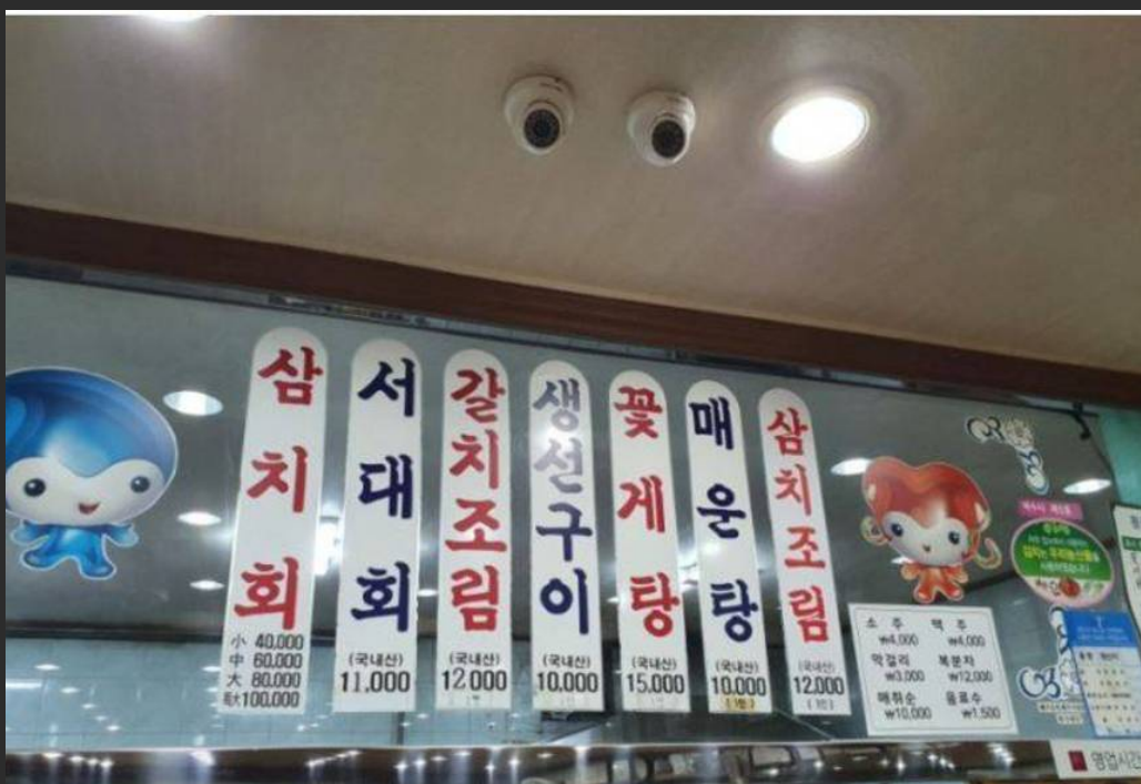
여수관광문화( http://tour.yeosu.go.kr )