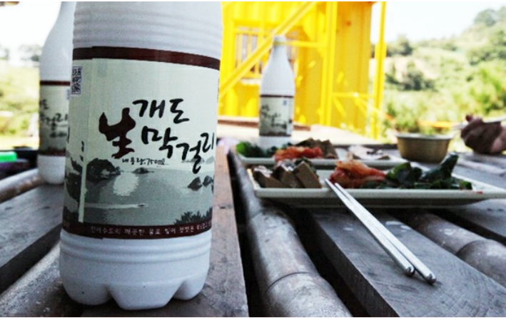
개도 막걸리 조선시대부터 만들어져 내려온 백년 역사의 개도 막걸리는 부드럽고 깔끔한 맛이 특징이다. 주민들은 개도 막걸리의 좋은 맛은 천제산 자락의 맑은 암반수, 즉 물이 좋기 때문이라고 한다

호령마을에서 시작되는 이 코스는 예부터 소몰이를 하던 코스이다. 소들의 목에 걸린 당그당 당그당 하는 위낭소리에 누구나 한번쯤 옛 시절의 정취를 느끼며 사색을 즐길 수 있는 길이다. 가파르고 힘은 들지만 그만큼 뛰어난 경치로 탐방객들의 땀을 보상해 줄 수 있는 코스이다.