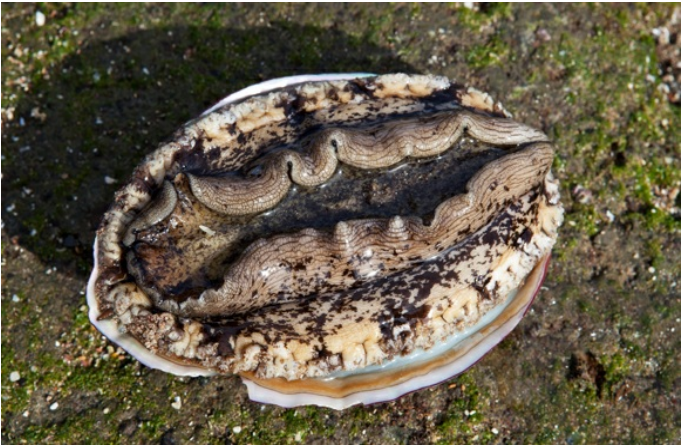
개도 참전복 깨끗한 개도 앞바다에서 자란 미역, 다시마 등을 먹고 자란 개도 참전복은 육질이 단단하고 쫄깃하다.