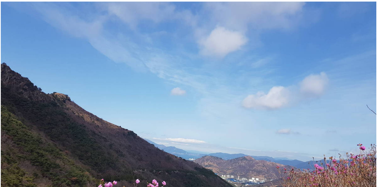
여수관광문화( http://tour.yeosu.go.kr )