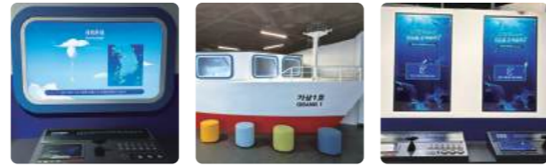
레원존데 기상 1호 아르고플로트

바다를 누비는 관측장비들을 통해 바람, 기온, 파고, 수온 염분 등의 해양기상 요소를 어떻게 측정하는지 알아보는 공간