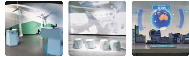
친환경 도시만들기 북극곰 가족 탄소중립 선언

바다와 기후변화의 관계를 이해하고, 기후 위기의 심각성을 체감하며 지구를 지키기 위한 실천을 약속하는 공간