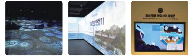
미디어아트 1관 미디어아트 2관 측우기

측우기와 미디어아트를 통해 과거의 과학과 현대 기술이 만나 날씨를 직접 느끼며 체험할 수 있는 공간