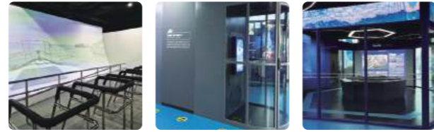
바다날씨의 위력 태풍 시뮬레이터 국가기상센터

태풍, 토네이도, 용오름, 해일, 이안류 등 바다에서 발생하는 다양한 날씨 현상을 직접 만들고, 보고, 체험하는 공간