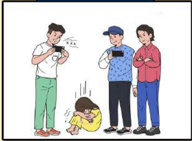
성인이 자신의 성적 충족을 목적으로 18세 미만의 아동에게 행하는 모든 성적 행위