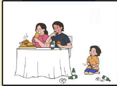
보호자가 아동에게 위험한 환경에 처하게 하거나 아동에게 필요한 의식주, 의료적 조치, 의무교육 등을 제공하지 않은 행위