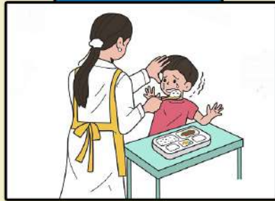
성인이 아동에게 행하는 언어적 모욕, 정서적 위협, 감금이나 억제, 기타 가학적인 행위