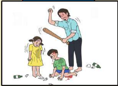
성인이 아동에게 우발적인 사고가 아닌 상황에서 신체적 손상을 입히거나 입도록 허용한 모든 행위