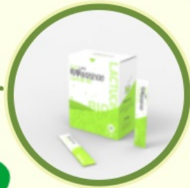
건조 분말 그린라떼

개천골영농조합법인 영농조합법인골든힐 (주)와인드와이어 흑하랑 상추 가공제품 수출 업무협약